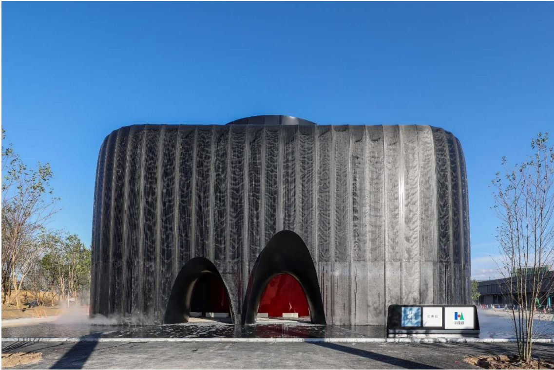
FUTURE OF LIFE

表彰対象者（応募者） 菅原雄一郎 石本建築事務所 遠藤治郎 合同会社 SOIHOUSE 住吉正文 ファロ・デザイン合同会社 辻和之 太陽工業株式会社 山本翔太 株式会社ウォーターデザイン